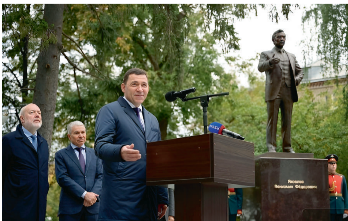
Губернатор Свердловской области Евгений Куйвашев выступает на открытии памятника Вениамину Яковлеву

Открытие памятника сопровождала рота почетного караула Центрального военного округа. После снятия полотна с монумента хор Екатеринбургской духовной семинарии исполнил песню «Славься» М.Глинки.