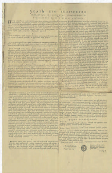
Печатный указ Петра I «О суде». 5 ноября 1723 г. ГАСО. Ф. 24. Оп. 1. Д. 43. Л. 86