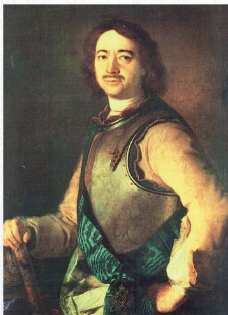
Император Петр I. Портрет. Худ. Арнольд де Гельдер. 1717 год.