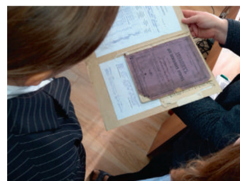
Дневник для записывания уроков, датированный 1897 годом, в Государственном архиве в городе Красноуфимске

Посетителям были представлены любопытные документы из фондов архива. Так, детей заинтересовал дневник для записывания уроков, датированный 1897 годом. Кроме того, ребята посмотрели номера газеты «Ленинский путь», в которых нашли информацию о начале Великой Отечественной войны 1941–1945 гг., увидели новости 1946 года о том, как проходила встреча красноуфимцев с известным уральским писателем Павлом Петровичем Бажовым.