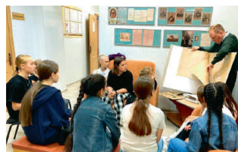
Учащиеся МБУ ДО ДЮЦ «Межшкольный стадион» во время экскурсии в Государственном архиве административных органов Свердловской области