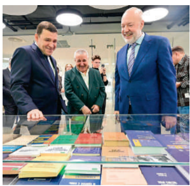
Губернатор Свердловской области Евгений Куйвашев (слева) и Павел Крашенинников (справа)