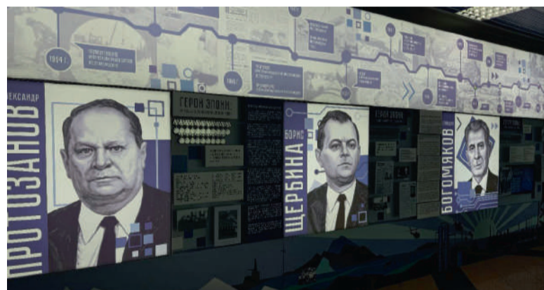
Выставочная экспозиция в рамках проекта «Легенды Ямала – в память о первых». Аэропорт г. Салехарда.