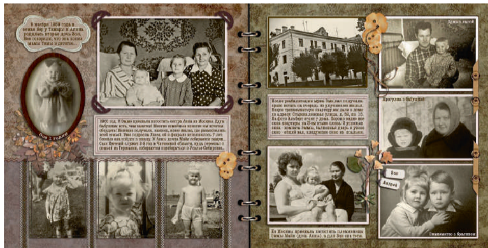
Оформление семейного альбома

Первым делом нужно внимательно просмотреть все фотонаследие и определить ценность каждого снимка. Из дубликатов и очень похожих снимков оставить самый лучший. Наверняка, обнаружится много фотографий, на которых изображены неизвестные люди. Их тоже лучше отложить в