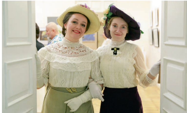
Гости выставки в платьях в стиле начала XX века

ленным комитетом договора с администрацией товарищества «Машаров и К°» об изготовлении ручных гранат. Понятно, что к работе на армию в годы Первой мировой активно привлекались частные компании.