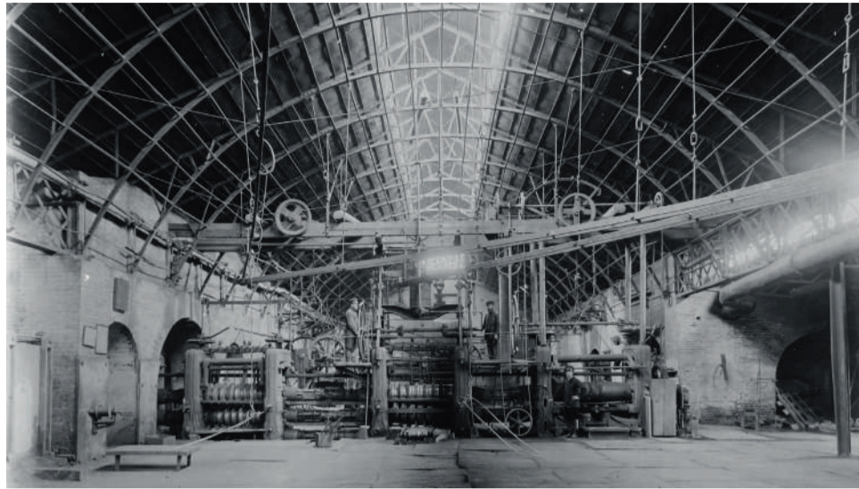
Прокатный цех Северского завода. Начало XX в.

В описях заводских строений за разные временные периоды неизменно фигурирует описание крепости: «...Около жилия и заложеной плотины и где быть фабрикам с трех сторон построена крепость строена палисадником всего на 500 на 14 сажень при ней назначено быть 4 бастиона... на северной стороне означенного места где быть пруду для нужного случая сделана батарея для содержания артиллерийских припасов...», рядом с крепостью «рогаток» деревянных с сигналами сто девяносто восемь», которые защищали завод от конницы неприятеля. Вне заводских стен располагались только церковь и небольшое количество жилых домов.