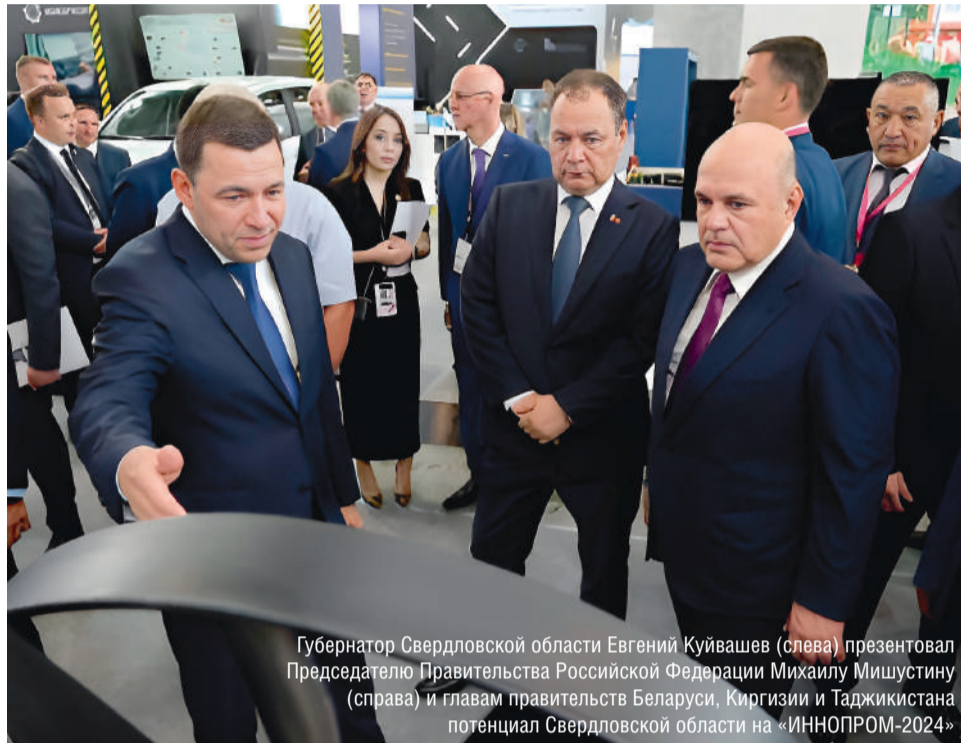
Губернатор Свердловской области Евгений Куйвашев (слева) презентовал Председателю Правительства Российской Федерации Михаилу Мишустину (справа) и главам правительств Беларуси, Киргизии и Таджикистана потенциал Свердловской области на «ИННОПРОМ-2024»