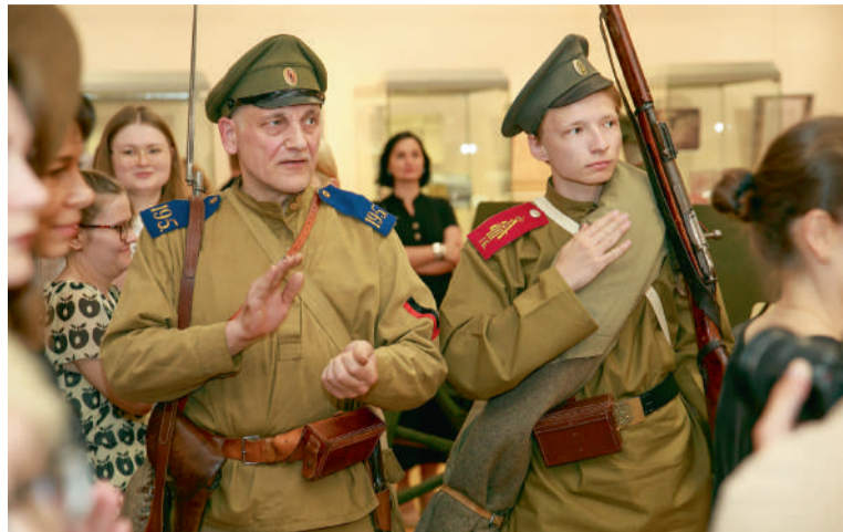
Представители Военно-исторического клуба «Горный щит» в форме и амуниции русских солдат Первой мировой войны

го населения плохо поддаются учету. Рухнуло четыре крупных мировых державы и среди них Российская империя. В 1917 году в России произошла революция и началась кровопролитная Гражданская война, которая по своим тяготам для нашей страны превзошла Первую мировую.