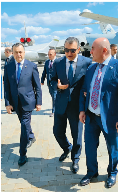
Премьер-министр Таджикистана Кохир Расулзода и заместитель председателя Законодательного Собрания Свердловской области Армен Карапетян

Общая площадь выставки составила 50000 кв.м, в четырех павильонах «ИННОПРОМ» свою инновационную продукцию представили 900 компаний и организаций из России и других стран мира. В выставке принимали участие компании из различных отраслей промышленности, включая