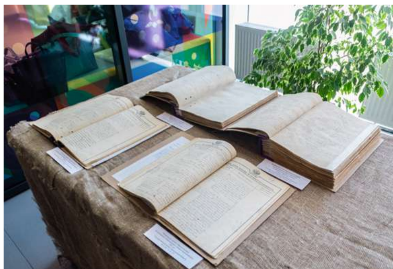
Метрические книги из фондов Государственного архива Свердловской области