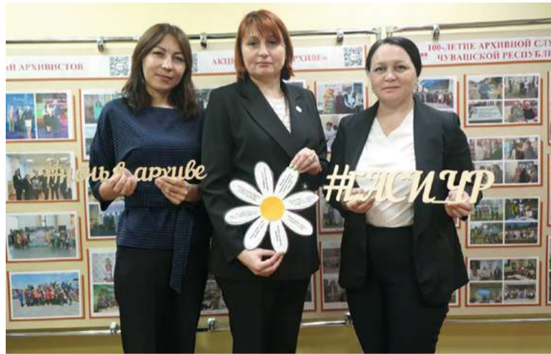
В Государственном архиве современной истории Чувашской Республики

Встреча условно была разделена на несколько блоков. В фойе госархива гостей встречали архивные профессионалы, которые дружно вводили посетителей в архивную среду и задавали направление маршрутов мероприя-