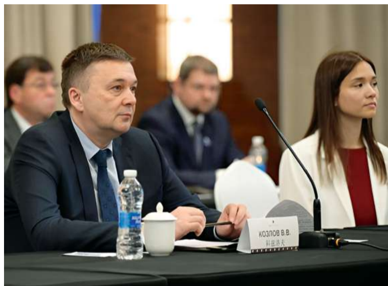
Заместитель Губернатора Свердловской области Василий Козлов

экономического и инвестиционного потенциала Свердловской области. Средний Урал заинтересован в продвижении своей продукции на китайский рынок. В течение нескольких дней представители власти и бизнеса провели ряд встреч и переговоров с иностранными партнерами, в том числе на коллективном стенде Свердловской области на площадке ЭКСПО.