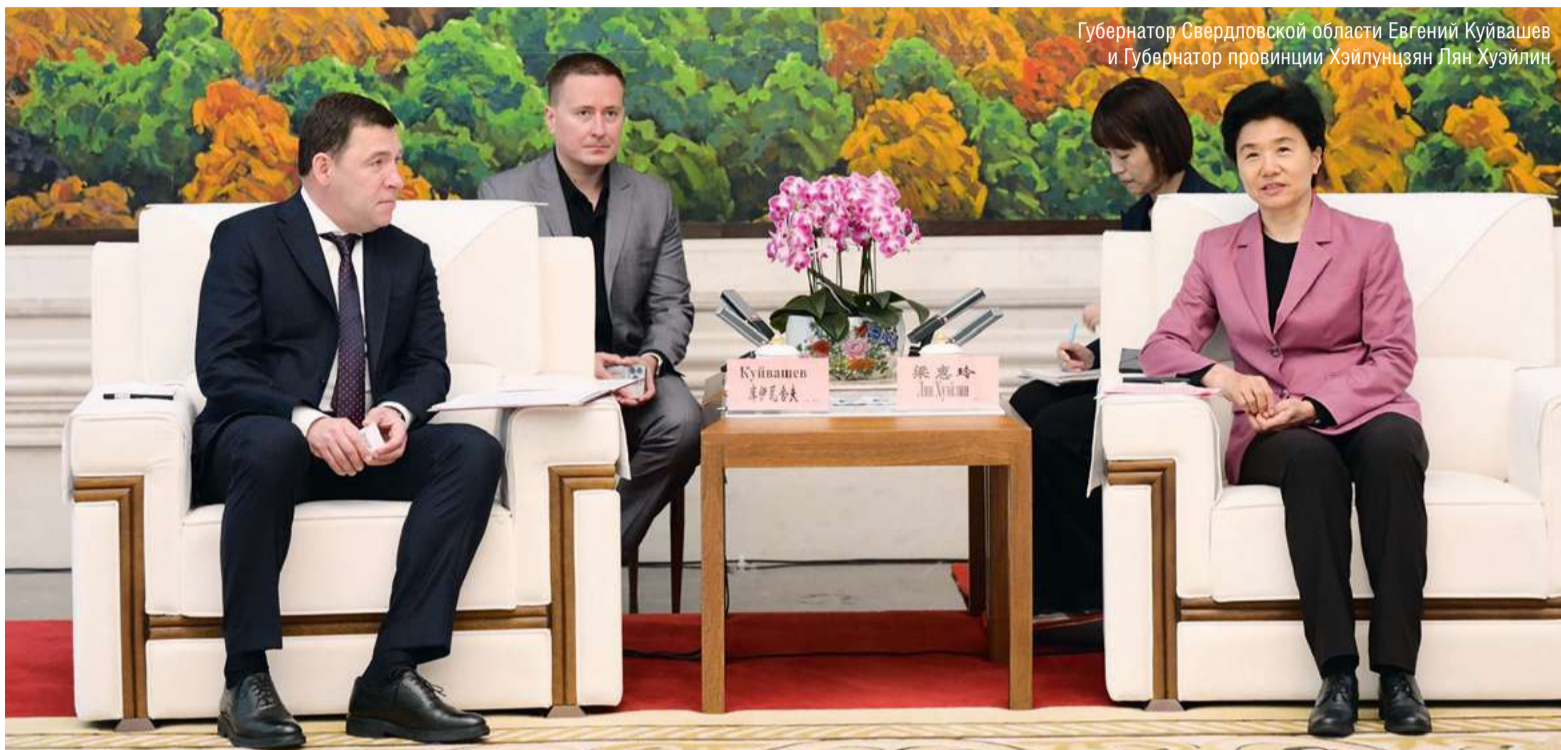
Губернатор Свердловской области Евгений Куйвашев и Губернатор провинции Хэйлунцзян Лян Хуэйлин.

В число участников ЭКСПО вошла и Свердловская область. Официальную делегацию возглавил Губернатор Евгений Куйвашев. Цель визита уральцев – развитие сотрудничества с провинциями Китайской Народной Республики, а также презентация