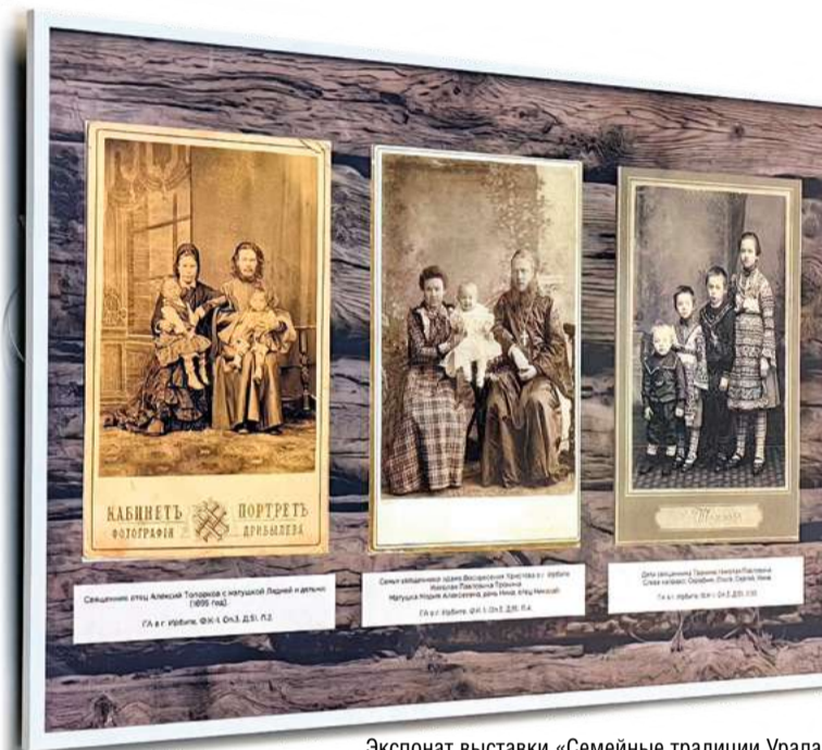
Экспонат выставки «Семейные традиции Урала»