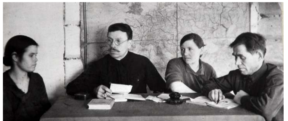
Совет опекунов рассматривает вопрос о нуждаемости подопечной семьи.

Питание в школах организовывали по мере возможности. Так, столовые имелись только при городской средней и неполной средней школах. Начальные средние школы получали питание из столовых Межрайторга и артели «Пищевик». Большим подспорьем были школьные подсобные хозяйства. Все школы должны были иметь посев в 100 га. На селе для школьников завтраки готовились из продуктов, выращенных на пришкольных участках. Во втором полугодии собственные припасы заканчивались, и питание детей ухудшалось, в городе школьникам давали 50 гр хлеба и 1 стакан горячего чая.