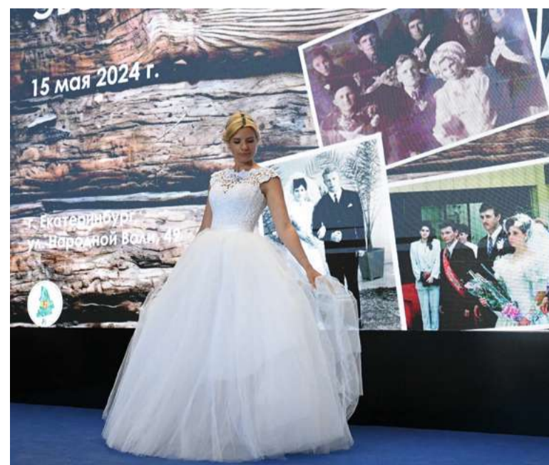
Показ свадебной моды