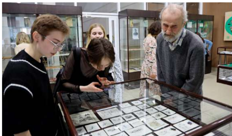
В Государственном историческом архиве Чувашской Республики

построения гармоничных отношений в семейной жизни. Было уделено внимание и теме единства и дружбы между коллегами по работе. Один из разделов выставки «Кровные узы» был посвящен судьбам, воспоминаниям и размышлениям известных людей, которые прославили свою родную республику. В этом разделе гости могли узнать о жизненных пути и достижениях выдающихся личностей, а также почерпнуть мудрые мысли и настроения о любви и семейных ценностях. Здесь были представлены истории о том, как люди преодолевали трудности и добивались успехов, не теряя при этом веры в себя и свою семью. В свою очередь, раздел выставки «Боевое братство» посвящен взаимопомощи и поддержке сослуживцев и родных в непростые годы