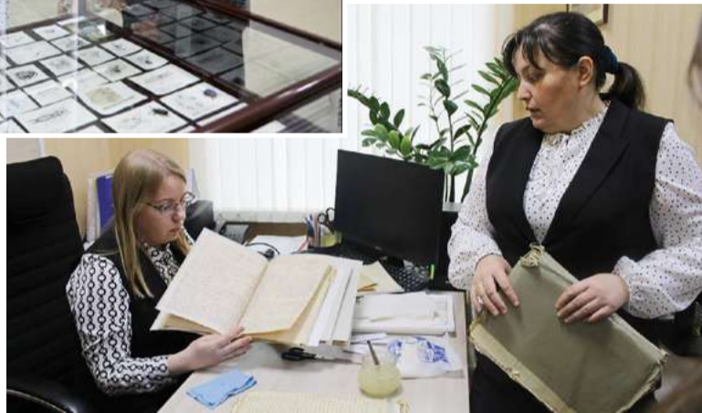
В Государственном архиве современной истории Чувашской Республики

На других площадках в это время тоже проходил активный интенсив, в т.ч. проведен мастер-класс по реставрации. Были продемонстрированы и интересные архивные документы: требник XVII века, коллективное письмо чувашских поэтов и писателей