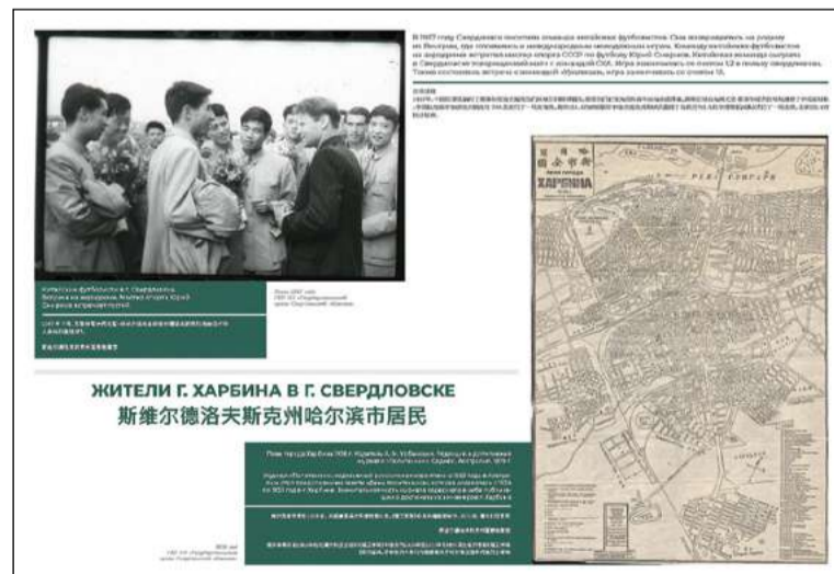
Экспонат выставки архивных документов «Урал Китай: путешествие по реке времени» на стенде Свердловской области

В статье использованы материалы с сайта Департамента информационной политики Свердловской области.