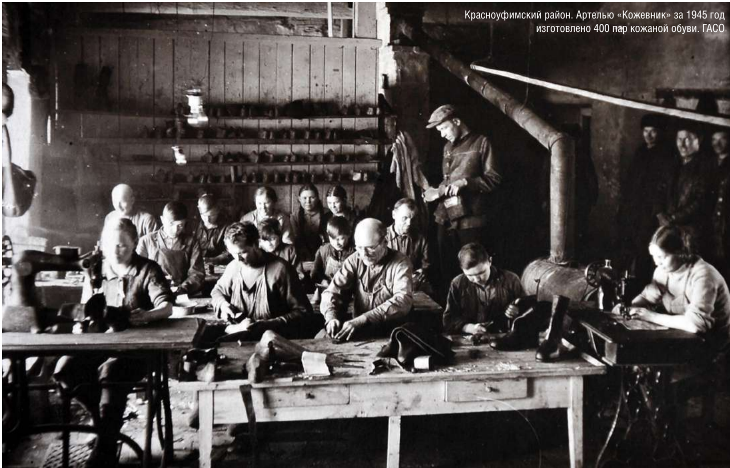
Красноуфимский район. Артелью «Кожевник» за 1945 год изготовлено 400 пар кожаной обуви. ГАСО