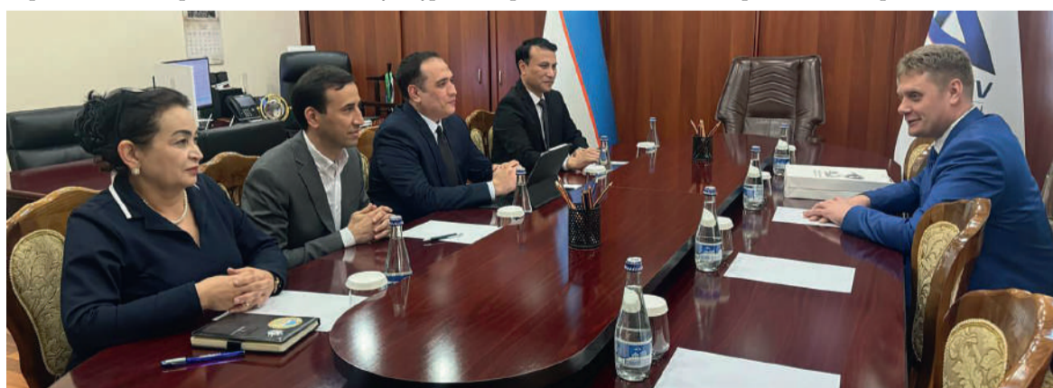
Начальник Управления архивами Свердловской области Роман Тараборин (справа) на встрече с руководством Агентства «Узархив» при Министерстве юстиции Республики Узбекистан

В публикации использованы материалы со страниц Информационного портала Свердловской области и Министерства международных и внешнеэкономических связей Свердловской области.