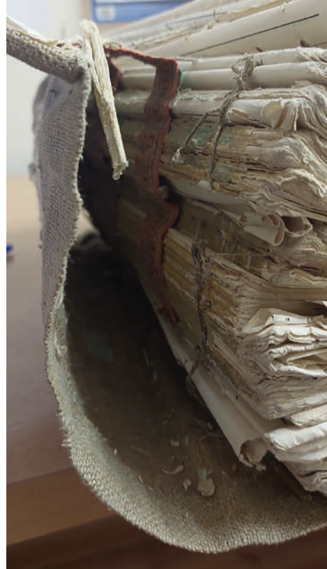
Метрическая книга, поступившая на реставрацию

Переходя к конструкции метрической книги, расскажем об особенностях прошивки листов: через весь блок книги делались пробои, как правило, у корешка близь нижнего обреза блока и прошивали