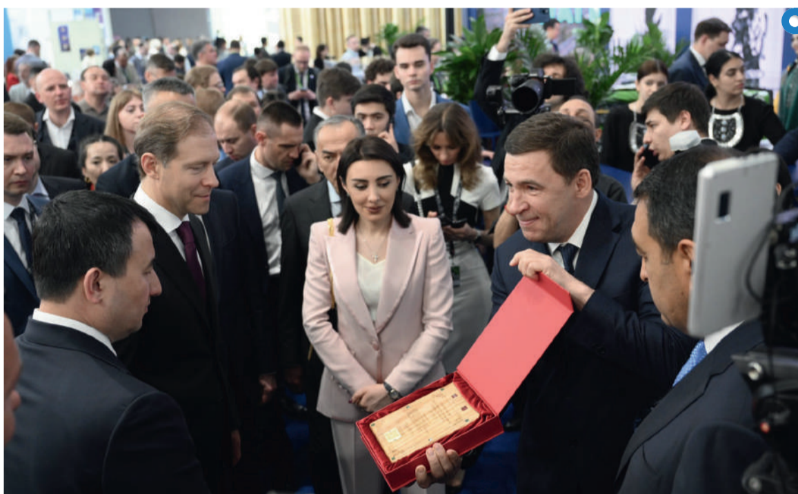
Губернатор Свердловской области Евгений Куйвашев (справа) презентует стенд региона на выставке «ИННОПРОМ. Центральная Азия» главам официальных делегаций России и Узбекистана: Заместителю Председателя Правительства Российской Федерации – министру промышленности и торговли Российской Федерации Денису Мантурову и Заместителю Премьер-министра Республики Узбекистан Жамшиду Ходжаеву

Свердловскую область на выставке «ИННОПРОМ. Центральная Азия» представляли свыше 60 региональных компаний. Все компании настроены на долгосрочные партнерские отношения с заинтересованными представителями