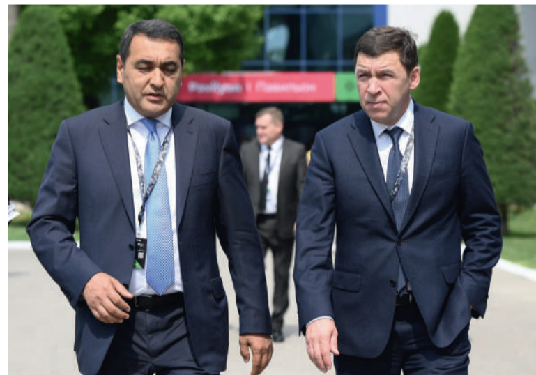
Рабочая встреча Губернатора Свердловской области Евгения Куйвашева (справа) с хокимом Ферганской области Хайрулло Бозаровым

В годы войны на территории нынешнего мемориального комплекса в Ташкенте располагался военный госпиталь и место захоронения скончавшихся от ранений солдат и офицеров. В