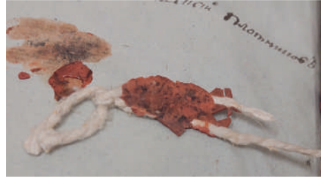
Сургучная печать и шнур, скрепляющий блок книги