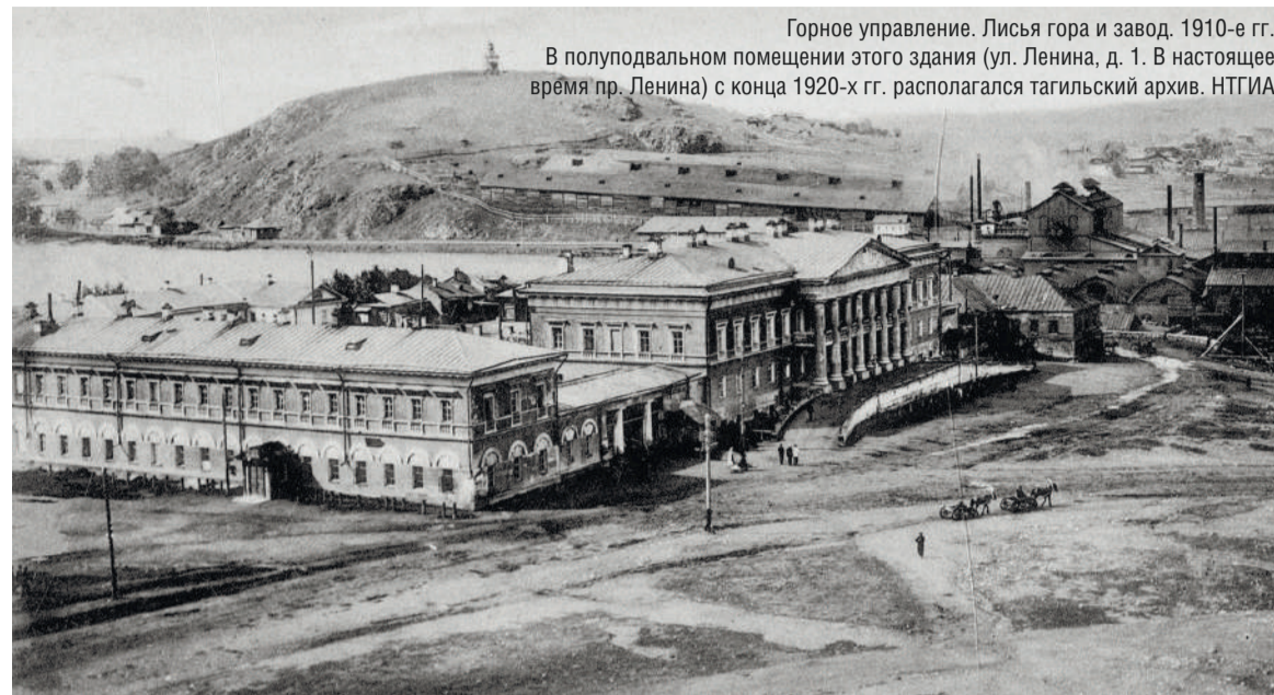
Горное управление. Лисья гора и завод. 1910-е гг. В полуподвальном помещении этого здания (ул. Ленина, д. 1. В настоящее время пр. Ленина) с конца 1920-х гг. располагался тагильский архив.

приняла постановление о дополнительном приеме на работу в архив сотрудников, закреплении за архивом до 1 октября всех ранее закрепленных кредитов и утверждении расходной сметы на 1800 рублей, «из которых 900 руб. отнесены за счет [местного] бюджета и 900 руб. за счет спецсредств, имеющихся в распоряжении Архивбюро».