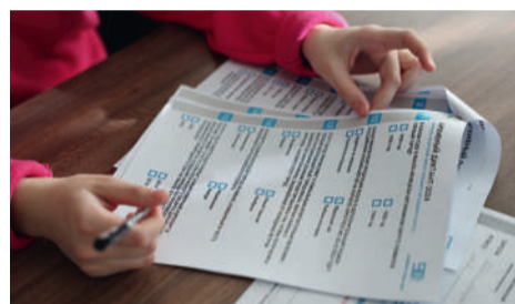
Просветительская акция «Архивный диктант» в рамках «Архивной декады - 2024»

Большое количество участников собрал в рамках декады «Архивный диктант». В этом году в нем участвовало порядка 400 человек на 11 площадках. Инициатором мероприятия, которое проводится в округе с 2022 года, является региональная Служба по делам архивов. Методическую помощь в его подготовке оказывает Всероссийский научно-исследовательский институт документоведения и архивного дела (ВНИИДАД). В диктанте приняли участие представители организаций – источники комплектования архивов, а также студенты по направлению документоведение и школьники. «Архивный диктант» проходил в форме тестирования и