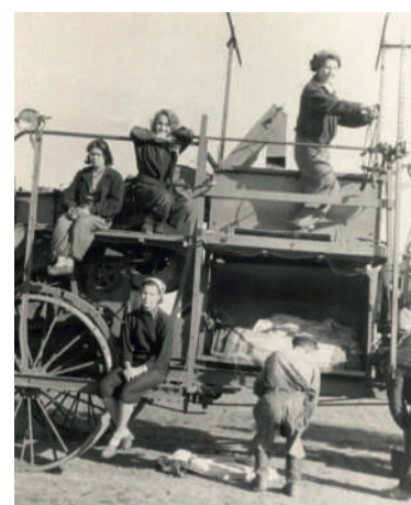
Алтайский край. Студенты УрГУ на целине. 1957 г.