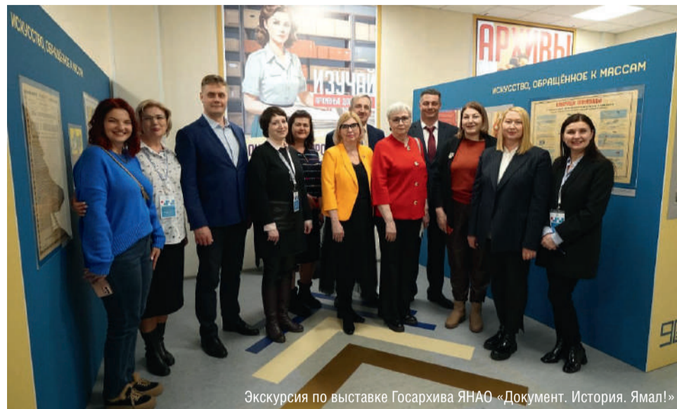
Экскурсия по выставке Госархива ЯНАО «Документ. История. Ямал!»

Ямала и старого Салехарда. В Год семьи особое место на выставке заняли семейные фотографии видных ямальских деятелей: В.Д.Артева, М.М.Броднева, Н.Б.Патрикеева, Н.И.Сандалова, Д.М.Чубынина и других. Все эти имена сегодня увековечены в наименованиях улиц окружной столицы и ямальских городов. Важное место в выставочном проекте заняла коллекция плакатов, почетных грамот и дипломов советского периода. В него вошел и особо ценный документ – плакат «Что дает туземцам Севера Советская власть?», выпущенный в 1920-е гг. в Свердловске.