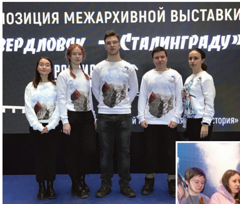
Члены Всероссийского общественного движения «Волонтеры Победы» (Свердловская область) провели акцию «Георгиевская лента» на открытии выставки «Свердловск – Сталинграду»

дополнили экспонаты, поднятые участниками поискового отряда «Ровесник» (Екатеринбург) на полях сражений под Волгоградом (Сталинградом). Руководители и бойцы отряда также выступили в качестве волонтеров-экскурсоводов на открытии и рассказывали всем гостям о предметах, которые удалось сохранить для истории в ходе вахт памяти. Необходимо отметить, что именно эта часть экспозиции вызвала у школьников и студентов наибольший интерес.