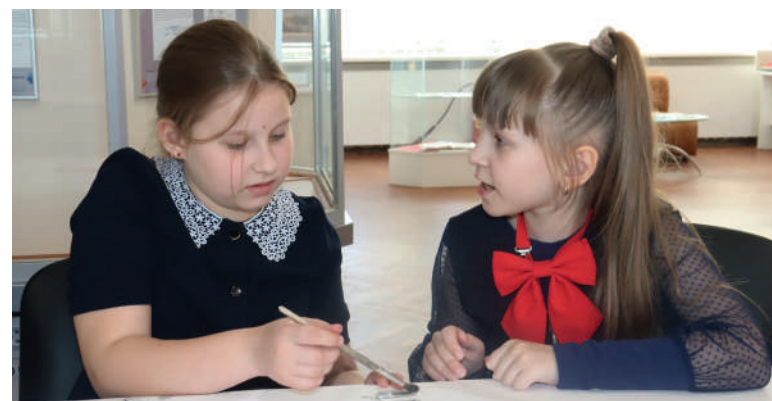
Выполнение дактилоскопического эксперимента

Разработка заданий по архивным документам стала для архивистов творческим и увлекательным процессом. Все задания созданы на основе использования изобретений, в числе которых различные способы шифровки, метод дактилоскопического анализа и др. Документ, лежащий в основе задания, выявлены в архивной коллекции заявочных материалов на изобретения. Эти документы помогали найти или расшифровать нужную информацию. Сама же информация была взята из документов, содержательно связанных с Самарой и Самарской областью. Краеведческий компонент – важная составляющая в воспитательной деятельности по формированию патриотического сознания, причастности к малой родине, возможность представить факты истории родного края в контексте истории страны. В связи с этим в игру были введены вопросы, получив ответы на которые, ребята узнавали новые сведения об истории Самары и Самарской области: известных земляках, промышленных объектах, природных богатствах. Отметим, что использованная в игре краеведческая информация является