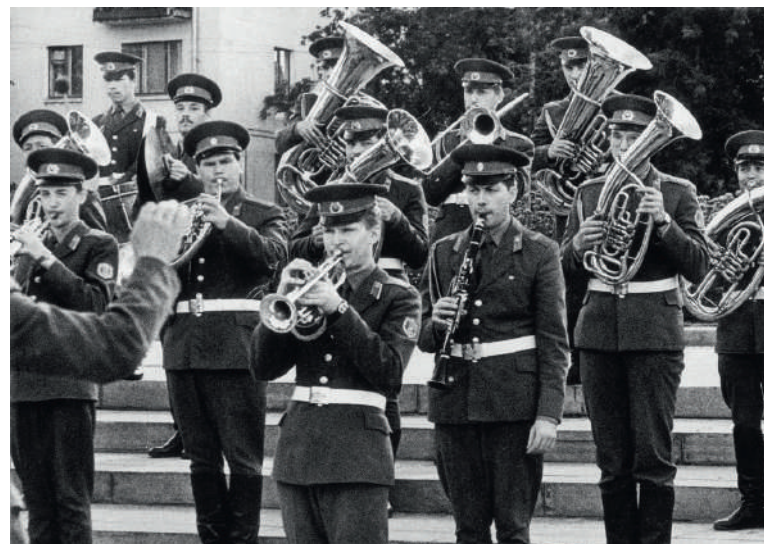
«Здравствуй, Кировский район». Социально-воспитательная работа в Кировском районе города Свердловска в 1987–1989 гг.: [Празднование дней Кировского района в Свердловске]. [1987-1989 гг.].

В проекте «Здравствуй, Кировский район». Социально-воспитательная работа в Кировском районе города Свердловска в 1987–1989 гг., подготовленном к юбилею района, представлена информация о формах и методах культурно-массовой работы, проводимой партийными организациями района.