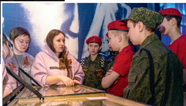
Рассказ о представленных на выставке «Свердловск – Сталинграду» экспонатах, поднятых участниками поискового отряда «Ровесник» (Екатеринбург) на полях сражений под Волгоградом (Сталинградом)

Необходимо подчеркнуть, что волонтеры, которые получили минимально необходимую информацию по правилам расшифровки исторических документов, справились с задачей очень хорошо. Как показала практика, в этом вопросе энтузиазм и целеустремленность имеют решающее значение. Сдру-