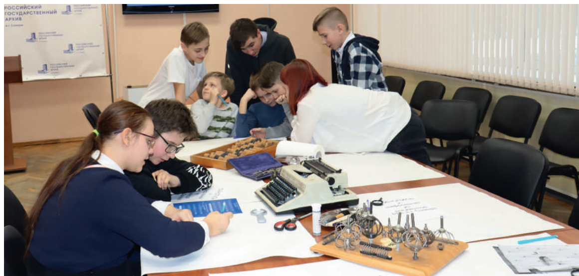
Группа архивных волонтеров на пилотной игре «Архивный детектив»

ПОИСКОВО-ИССЛЕДОВАТЕЛЬСКАЯ ИГРА ПО НАУЧНО-ТЕХНИЧЕСКИМ ДОКУМЕНТАМ