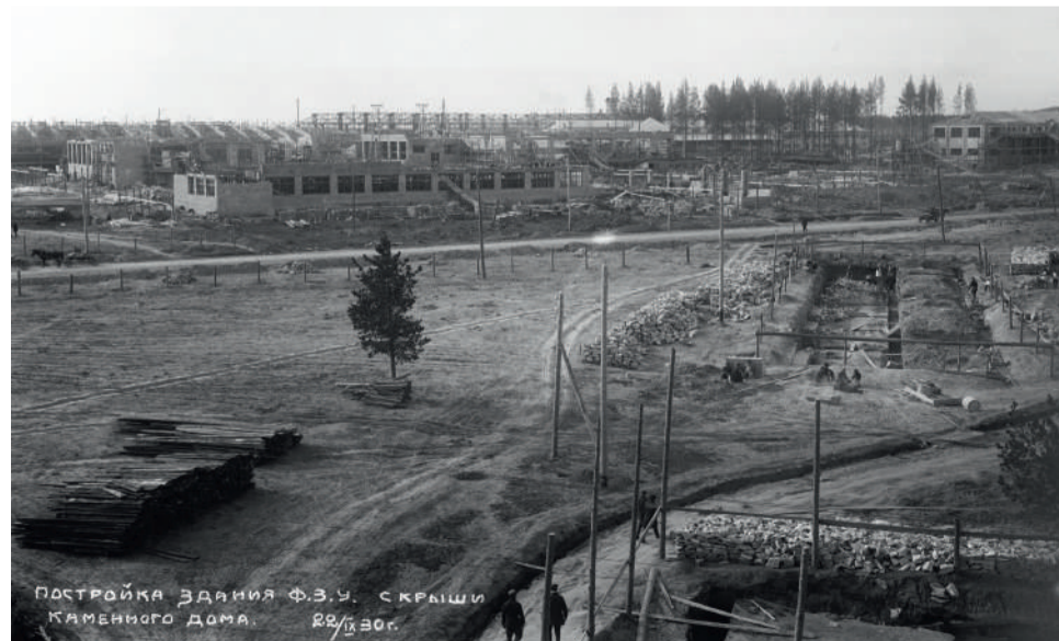
Поселок Уралмаш. Строительство школы фабрично-заводского ученичества. В настоящее время – Екатеринбургский промышленно-технологический техникум имени В.М. Курочкина (ул. Машиностроителей, д. 13). К. Татарченко. 22 сентября 1930 г. ГАСО

научный сотрудник отдела научно-исследовательской и методической работы Государственного архива Свердловской области.