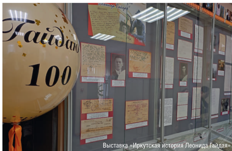
Выставка «Иркутская история Леонида Гайдая»

самых любимых, самых знаковых мест с кратким их описанием и объяснением выбора. Идея выставки такова: Иркутская область очень разнообразна, это один из самых крупных регионов страны, объехать или обойти ее целиком – мероприятие практически нереальное. Но все вместе мы способны составить её портрет, написав каждый о маленьком кусочке своей малой родины – самом любимом и знаковом месте. Все присланные фотографии были собраны в электронную выставку, опубликованы и истории, присланные вместе с фотографиями. Получилась не просто выставка, а целый