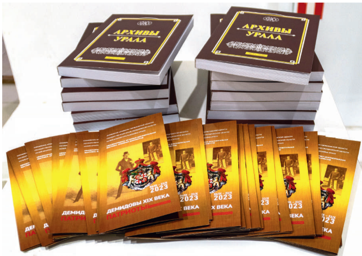
Буклеты к выставке «Демидовы XIX века: патриоты и космополиты» и издание архивной службы Свердловской области «Архивы Урала»

«Горнозаводской Урал» и уникальные экспонаты по истории Демидовых, предоставленные Фондом по поддержке и сохранению культуры и искусства «МомАртФонд». Кроме того, на выставке имеется возможность ознакомиться с историческими справками и личными документами представителей рода Демидовых при работе с мультимедийным экраном, который был приобретен в рамках программы.