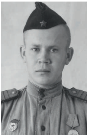
Иван Лаврентьевич Речкалов. Портрет. 1943 г.

В воздушном бою на Курско-Белгородском направлении с немецко-фашистскими захватчиками проявил мужество и героизм, за что был награжден медалью «За отвагу», при этом был тяжело ранен в левую руку, левое легкое. Из наградного листа: «...10 июля 1943 года при выполнении боевого задания группа 8 самолетов ИЛ-2 в районе Грязное, Рьельский была атакована 4 МЕ-109 и 4 ФВ-190. В этом бою тов.Речкалов показал образцы мужества и героизма, отразил 3 атаки противника и, несмотря на полученное тяжелое ранение, до конца вел бой, в результате которого подбил один МЕ-109». После тяжелого ранения, негодный к службе на передовой, Иван Лаврентьевич работал в административных органах 8-й гвардейской штурмовой Полтавской авиадивизии на территории Поль-