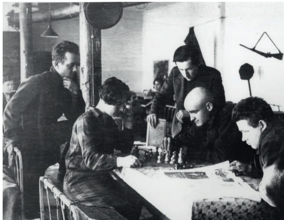
Члены коммуны Уралмашстроя в комнате общежития. 1931 г. (Копии фотографий периода строительства Уралмашзавода и Великой Отечественной войны, переданные из музея УЗТМ).

Действует и поныне школа №22 (ул.Красных партизан, 4). В школе есть музей, посвященный ее истории. В 1980-е годы к историческому зданию пристроили еще один корпус, а в 2000-е годы школа претерпела масштабную реконструкцию.