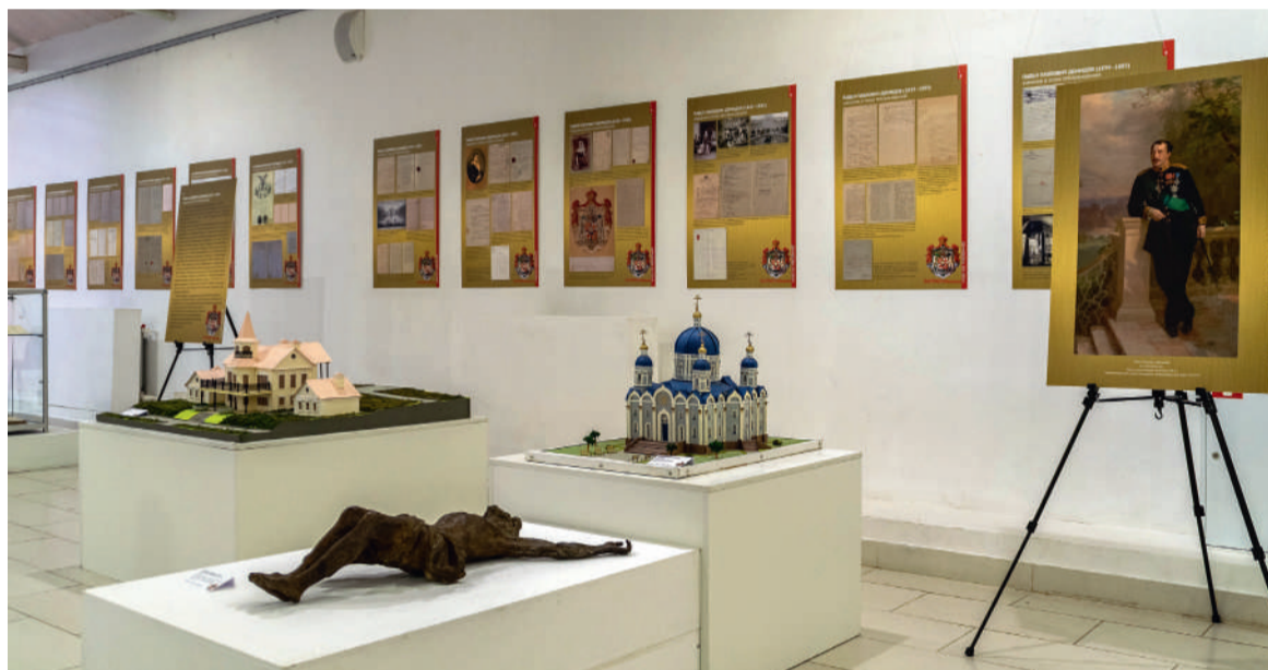
Экспозиция выставочного проекта «Демидовы XIX века: патриоты и космополиты» в Музее архитектуры и дизайна Уральского государственного архитектурно-художественного университета