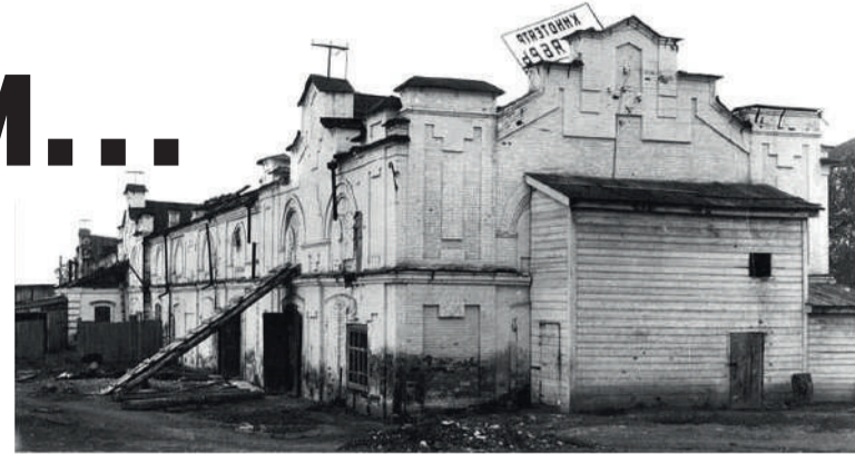
Здание кинотеатра «Октябрь» до 1969 года.

С 2004 года на протяжении 8 лет кино в Красноуфимске не демонстрировали. Возобновили показ кино лишь в 2012 году в Центре культуры и досуга, где оборудовали кинозал на 514 мест, а в 2018 году дополнительно оборудовали малый кинозал на 40 мест, оснащенный самым со-