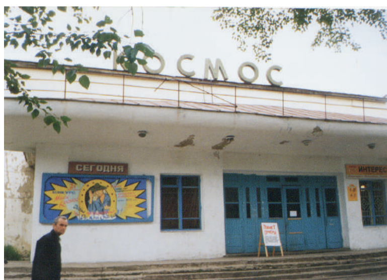
Здание кинотеатра Космос. 2002 г.