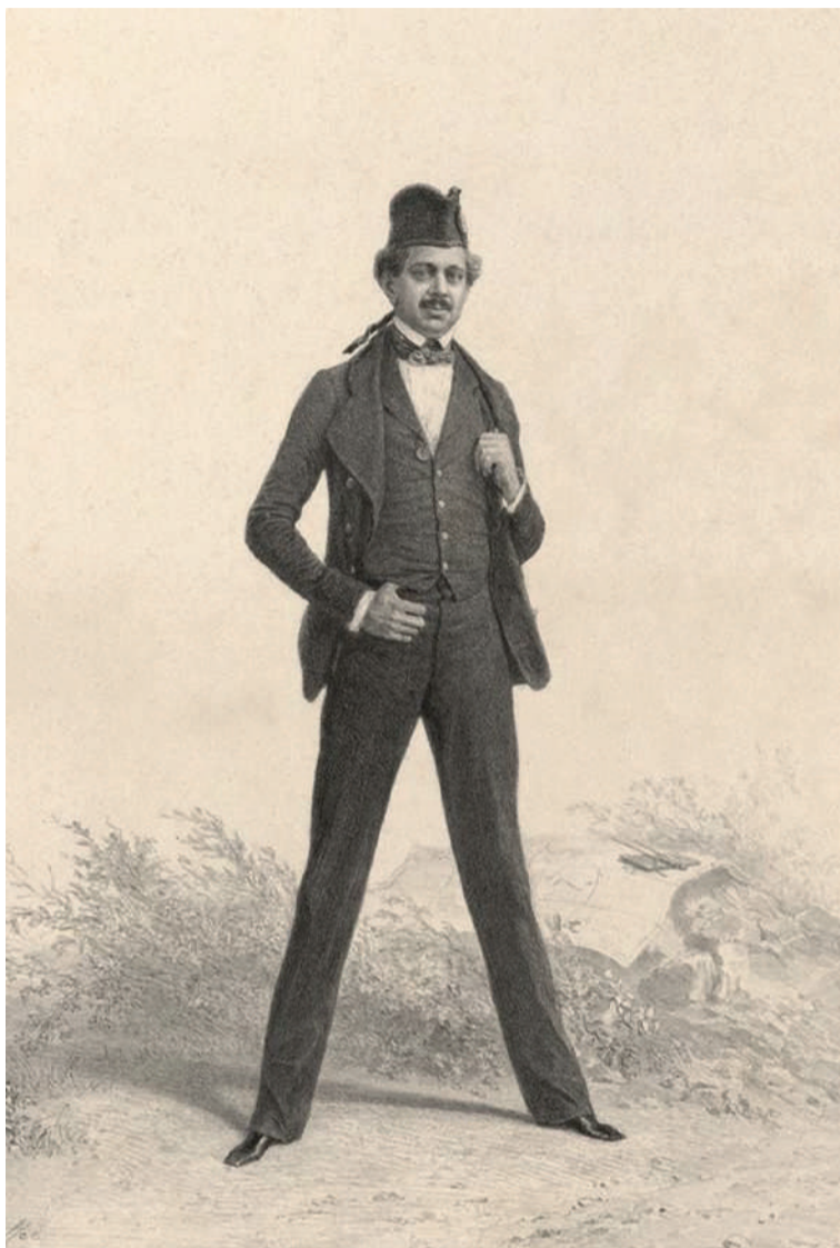
Князь Анатолий Николаевич Демидов (Портрет в полный рост). Б/д.

учебным заведениям, а также для того, чтобы войти в доверительные отношения с влиятельными представителями обществ Франции и Италии, они инициировали создание попечительских советов для курирования основанных ими учебных заведений или входили в состав уже имеющихся попечительских советов.