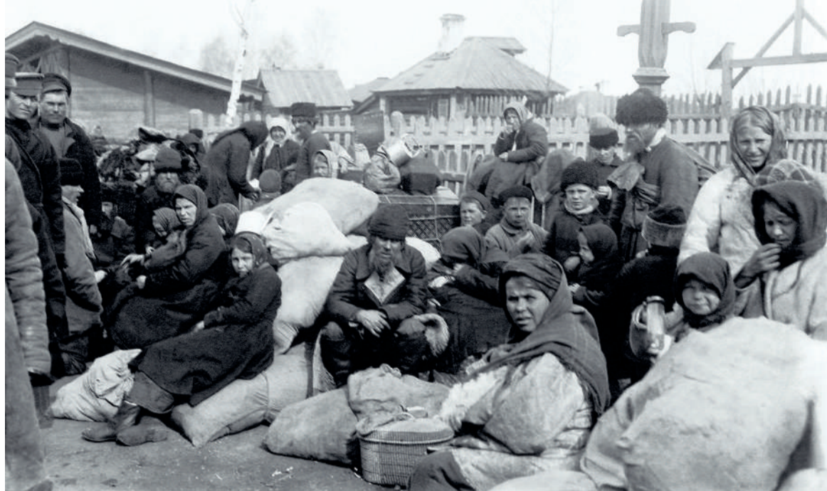
Переселенцы на Челябинском переселенческом пункте. 1910 г. ОГАЧО

Посетители выставки найдут среди экспонатов «Письмо Петра I В. де Геннину с выражением благодарности за пущенные заводы, медные и железные». Документ примечателен тем, что является одной из первых официальных бумаг, где упоминается город Ека-