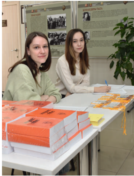
Регистрация участников научно-практической конференции «Генеалогия и архивы»

селе факты биографии легендарного снайпера, но и выявлена проблема отсутствия полного научного описания жизненного пути этого человека. Что является серьезной проблемой для исторической науки в целом и, несомненно, требует решения.