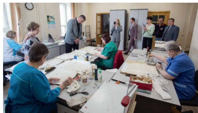
Экскурсия по лаборатории реставрации архивных документов Объединенного государственного архива Оренбургской области

В 2020 году по итогам двухлетних переговоров с краевым во-