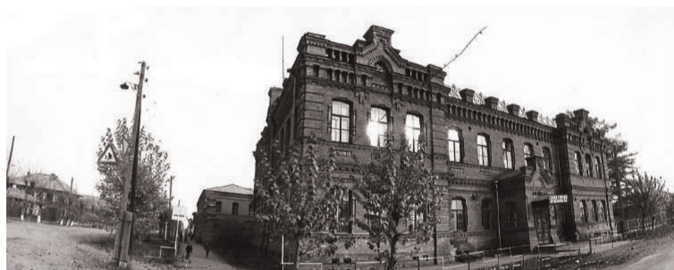
Бывшая мужская гимназия. Общий вид. Ирбит, ул.Свободы, 24. 1978 год.

3. В учебный план школ, начиная с 1 класса, было введено военное дело.