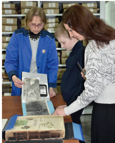
Участники акции «Ночь в музее»

В рамках фестиваля прошла межрегиональная историко-архивная конференция «История регионов в памяти поколений». Конференция началась с докладов, посвященных вопросам репрезентативности архивных документов и роли экспертизы ценности документов, работе информационной системы удаленного использования архивных документов. Географию участников конференции составили архивисты, историки, сотрудники музеев и преподаватели высших и общеобразовательных учреждений из 8 регионов Приволжского федерального округа: Ульяновской, Самарской, Саратов-