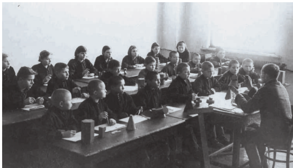
Учащиеся системы профессионально-технического образования Свердловской области в годы Великой Отечественной войны.

Школьное образование на Урале с первых дней войны подверглось перестройке. Часть школьных зданий была передана на военные нужды: под госпитали, призывные пункты. Ухудшилось снабжение школ учебниками, оборудованием, письменными принадлежностями. Наплыв на Урал эвакуированных детей создал переполнение классов, занятия проводились в две-три, а иногда и в четыре смены. Увеличился «отсев» учащихся, часть старшеклассников ушла на фронт, другие стали работать. В школах вводилась обязательная военная и физическая подготовка. Школьники своим трудом помогали промышленным предприятиям, участвовали в сельскохозяйственных работах.