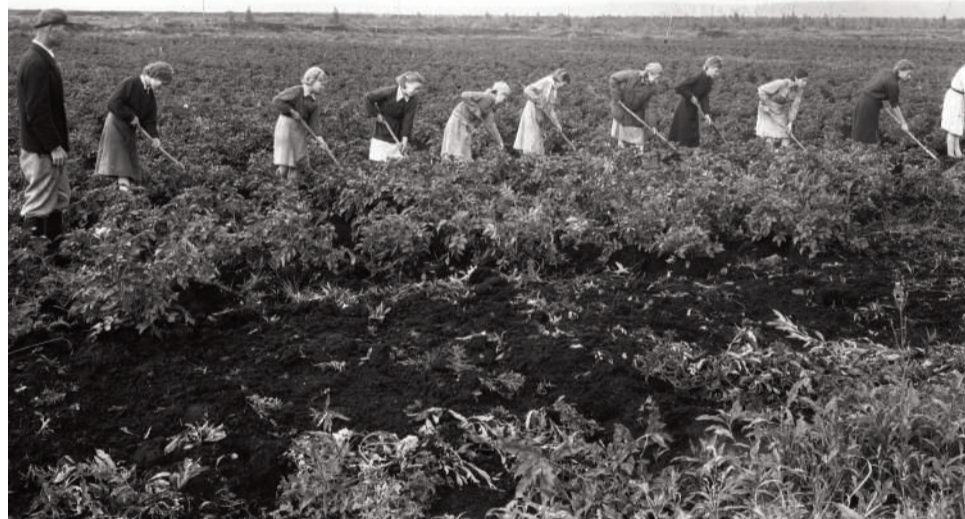
Прополка овощей в подсобном хозяйстве ремесленного училища. г.Свердловск.1943–1944 гг. ГАСО

Особую роль в воспитательной работе играла внеучебная деятельность школ. Во время войны вся внеклассная работа в школе ориентировалась на военно-патриотическое воспитание учащихся. Большую помощь учителям в воспитании школьников оказывали комсомольские и пионерские организации.