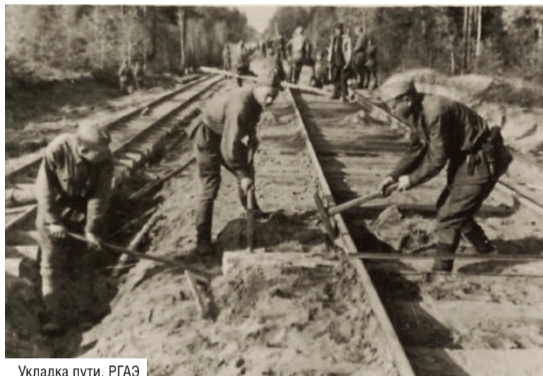
Укладка пути.

Значение ГОРЕМ-36 для достижения победы и в прокладке транспортных магистралей в мирный период в северном регионе обусловило продолжение исследовательской работы о судьбе организации. К настоящему времени ямальскими архивистами были выявлены документы в Российском государственном архиве экономики (РГАЭ). Часть из них (отчеты и фотодокументы) приобретены Государственным архивом ЯНАО и включены в фонд пользования.